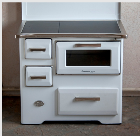
SD7 RS i SD7 SL sa niklovanim ramom