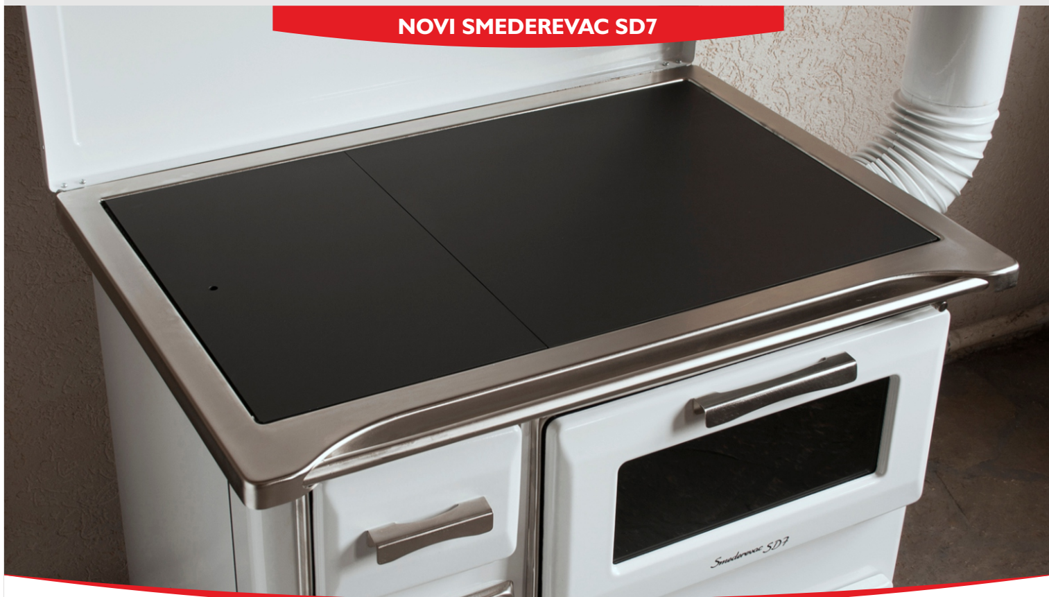
NOVI SMEDEREVAC SD7