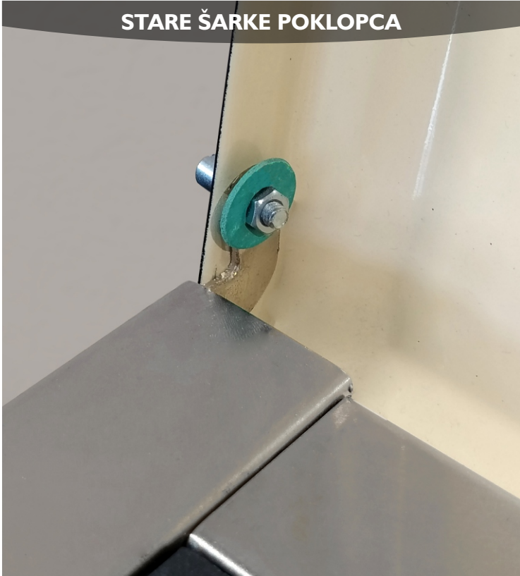
STARE ŠARKE POKLOPCA