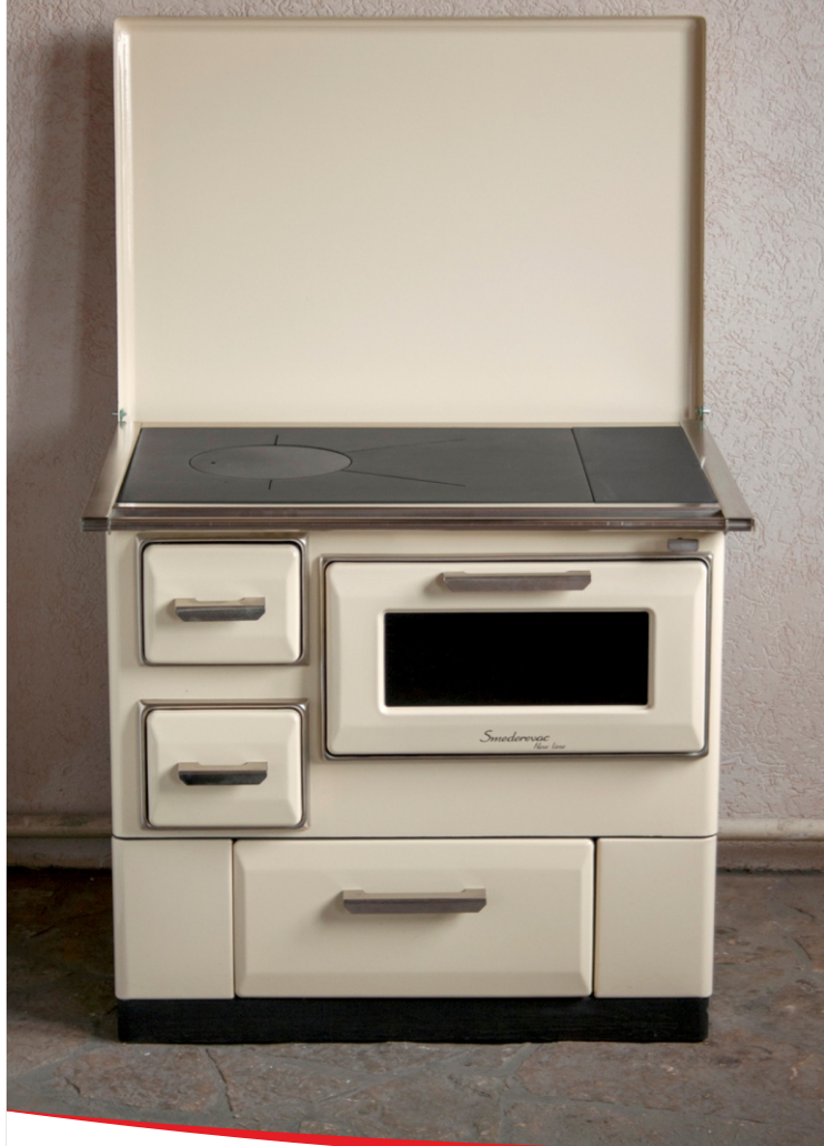
STARI SMEDEREVAC SD7