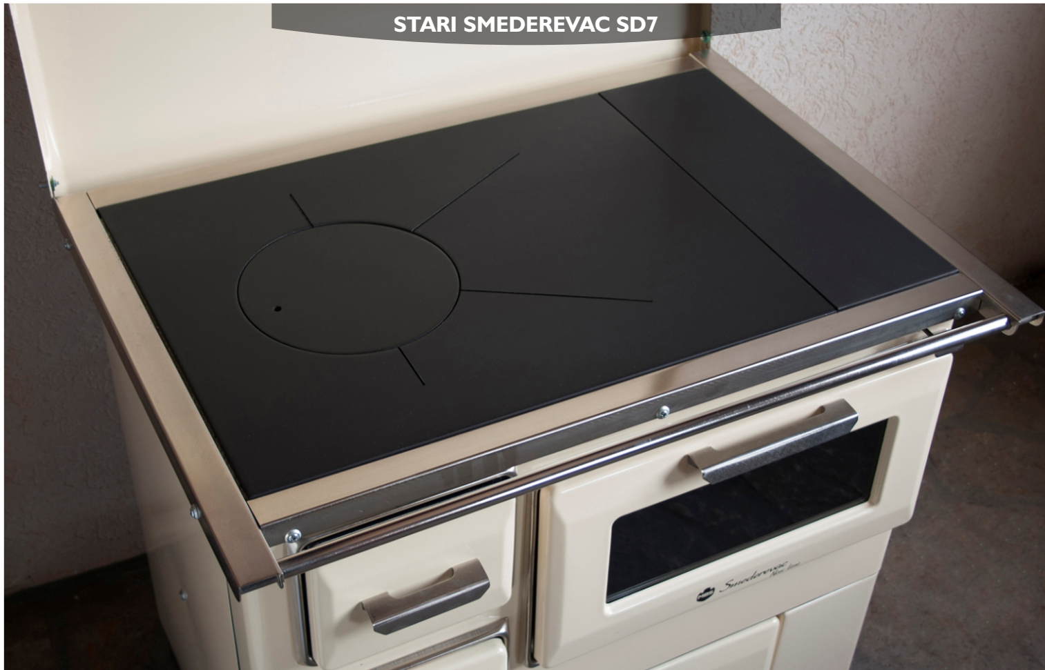
STARI SMEDEREVAC SD7