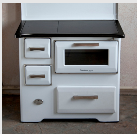
SD7 RS i SD7 SL sa emajliranim ramom